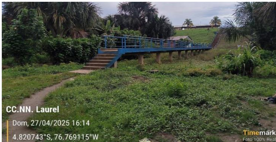
FIGURA N°03: ESCALERA PEATONAL EXPUESTA A LA EROSIÓN FLUVIAL