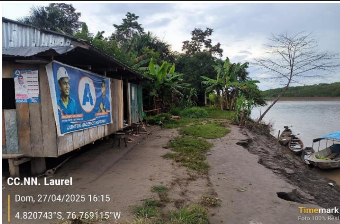
FIGURA N°01: VIVIENDAS EXPUESTAS A INUNDACIONES