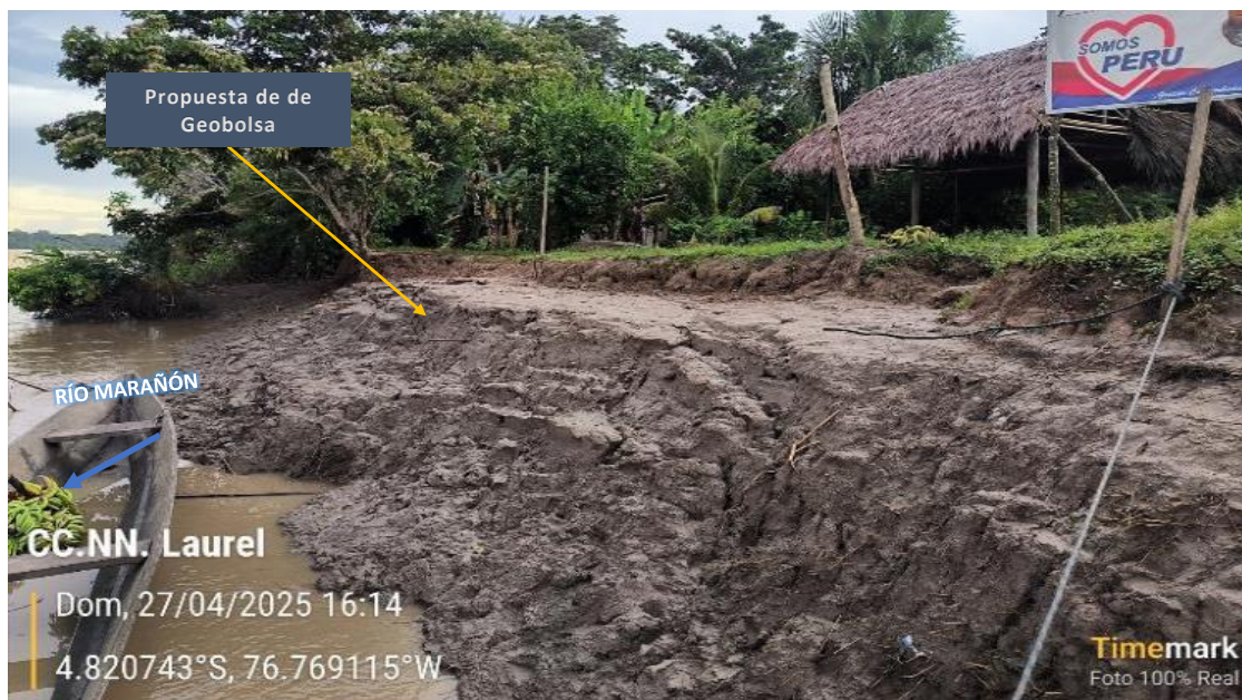
FIGURA N°02: RIBERAS EXPUESTAS A LA EROSIÓN FLUVIAL